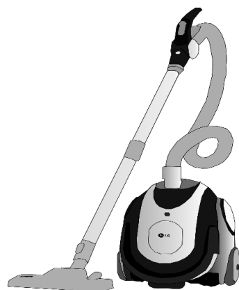
Rysunek 1.

Nauczyciel wyświetla wybrany obraz związany z obowiązkami domowymi,