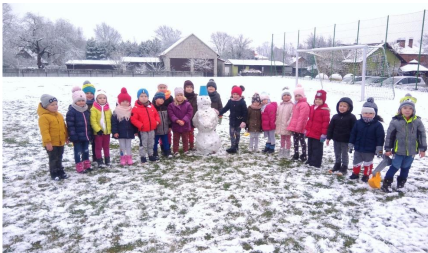
Zdj. 1. Podczas zajęć Dołączam do zabawy . Dzięki współpracy wszystkich przedszkolaków udało się ulepić pięknego bałwana. Autor: K. Barszczak.

Poza planami aktywności na zajęciach korzystano z różnych metod. Prowadzono zabawy integracyjne, ruchowe, naśladowcze. Nauczyciel przygotowywał teatryki i opowiadania, dzieci wykonywały prace plastyczne oraz układały historyjki obrazkowe, korzystały również z lizaków emocji oraz wykonywały ćwiczenia oddechowe.