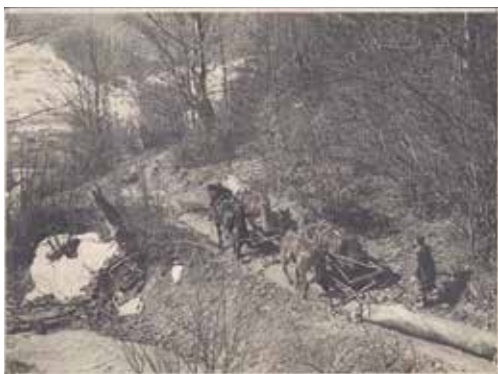
Kalnica, zrywka drewna na dwie pary koni. Arch. B. Bajorka