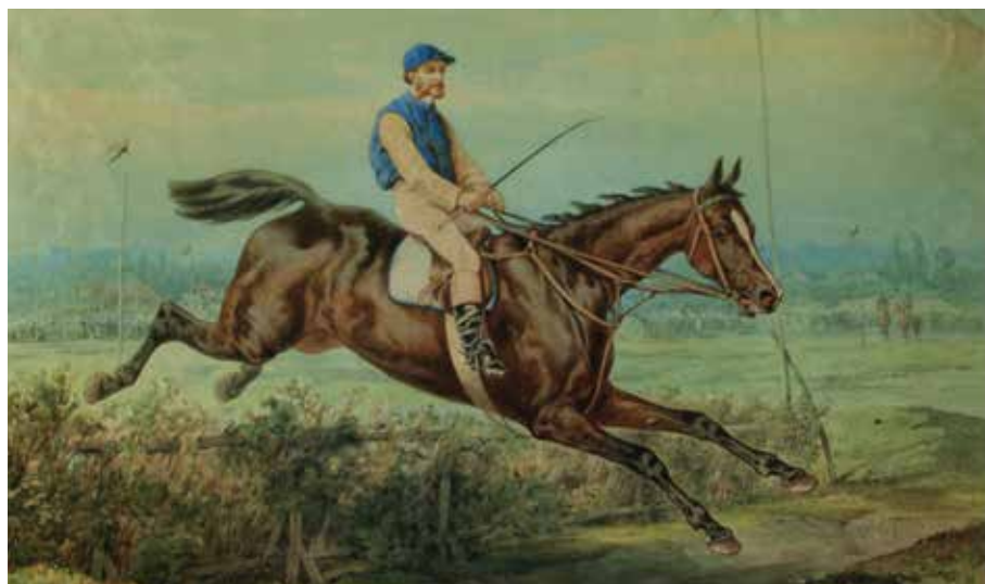
Obrazy z kolekcji Dzikowskiej (Tarnobrzeg)