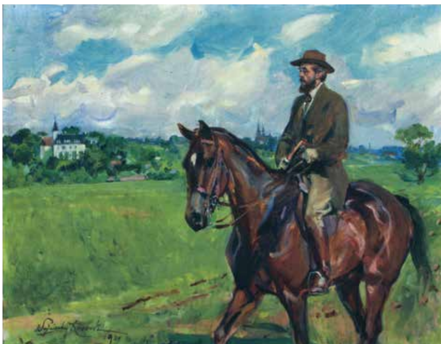
Zdzisław Jan Tarnowski