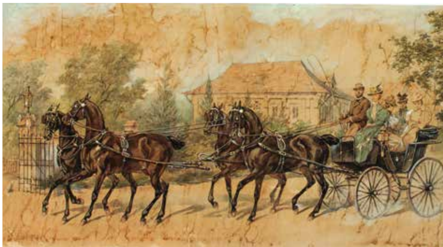
Obrazy z kolekcji Dzikowskiej (Tarnobrzeg)