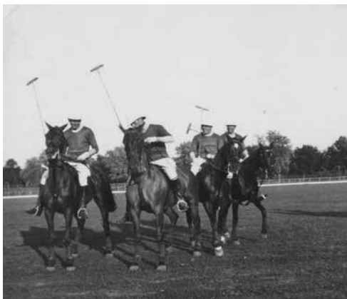
Łańcucka drużyna polo