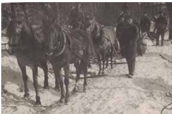
Nadleśnictwo Oleszyce. Zrywka drewna w parku Zabiąta