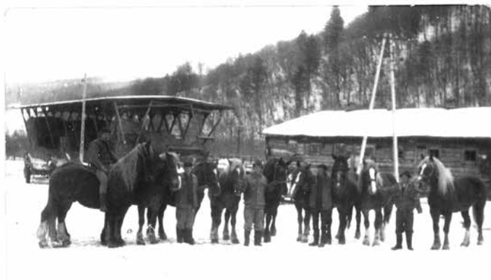
Nadleśnictwo Lutowiska - park w Dwerniku, coroczny przegląd koni.

w Siankach, Sokolikach, Tarnawie Wyżnej i Mucznem. Park miał pełną obsadę kadrową: rymarz, stelmach, kowal, stajenny, wozacy, pomocnicy i brygadzysta. Zlikwidowano go 18 kwietnia 1992 roku.