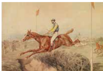
Obrazy z kolekcji Dzikowskiej (Tarnobrzeg)