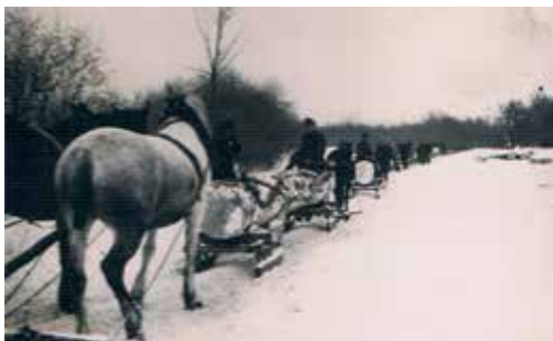
Nadleśnictwo Dynów, transport drewna zimą.