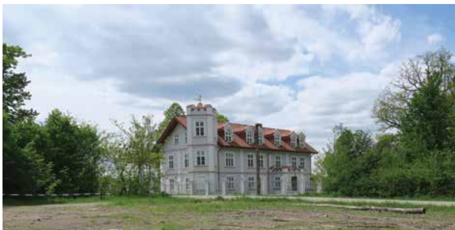
Widok na pałacyk w Morgach z miejsca, gdzie znajdował się park konny.