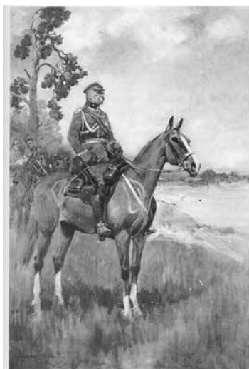
Wojciech Kossak, Józef Piłsudski na Kasztance