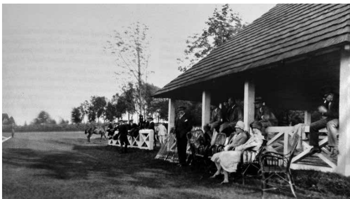
Łańcucki polo-plac (Muzeum Zamek w Łańcutcie)

Jak w coś wkładać serce, to z rozmachem. Polo bez odpowiedniego boiska to tylko prowizorka, więc w 1912 roku ruszyła operacja „plac marzeń”. Miejsce wybrano nie byle jakie – urokliwie położone między torami kolei wiedeńskiej a bazantarnią, na ówczesnym skraju Łańcuta. Wstępny kosztorys wyniósł 3.000 koron, co mogło przyprawić o zawrót głowy, ale Alfred miał wielkie plany uczynienia z Łańcuta centrum polo w Polsce. Na polo-placu wkrótce stanęły białe bandy i stylowa, drewniana, lakierowana łoża z wiklinowymi meblami dla widzów. Wyścigi w Ascot by się nie powstydzily.