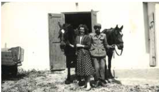
Dynów, konie Atom i Kuba z Parku Konnego Nadl. Dynów.