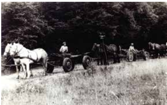
Nadleśnictwo Sieniawa. Brygada PK wyjeżdżająca do pracy w leśnictwie Zaradawa