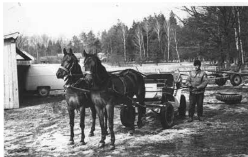
Nadleśnictwo Kolbuszowa, park konny Morgi.

Państwowy transport konny miało Nadleśnictwo Kolbuszowa , gdzie w 1957 roku w oddziale 171 zorganizowano park konny Morgi, przy ówczesnym nadleśnictwie o tej samej nazwie. Rejon Lasów Państwowych w Leżajsku przydzielił ówczesnemu nadleśnictwu 11 koni. Po reorganizacjach, w latach 80. XX w., w Nadleśnictwie Kolbuszowa było 6 par koni, które rozlokowano w czterech miejscach. Dwie pary utrzymywano w Morgach, dwie pary w leśnictwie Poręby Dymarskie, po jednej w leśnictwach Wilcza Wola i Nowa Wieś. Konie służyły przede wszystkim do zrywki drewna w trzebieżach młodszych klas wieku, gdzie nie mieściły się ciągniki 6 . Po prywatyzacji prac leśnych w 1993 r. konie zostały sprzedane wozakom, którzy je wcześniej obsługiwali 7 .