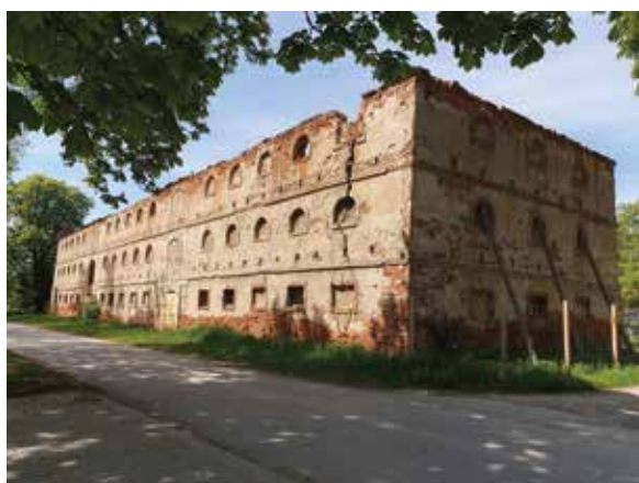
Spichlerz w Sieniawie, stan obecny.